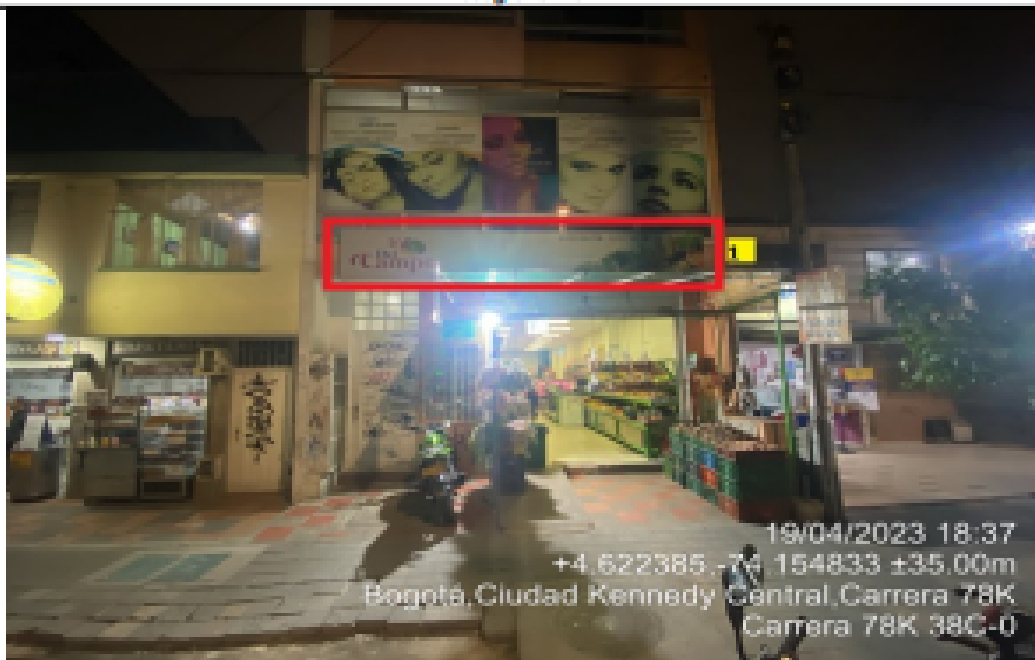
Fotografía No. 2

En la cual se evidencia la fachada del establecimiento comercial FRUVER DEL CAMPO EL PAISA, en la que se observa: un (1) elemento publicitario tipo aviso en fachada identificado con el número 1, el cual al momento de la visita técnica se encontraba instalado sin contar con el registro ante la SDA.